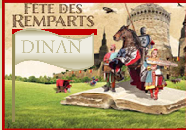
FÊTE DES REMPARTS