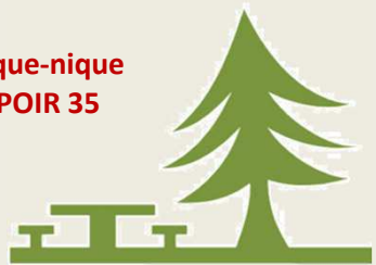
Pique-nique ESPOIR 35