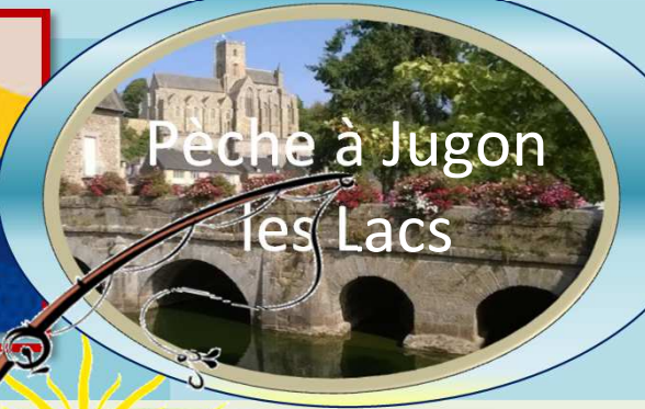
Pêche à Jugon les Lacs