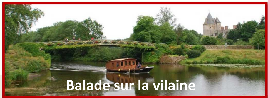
Balade sur la vilaine