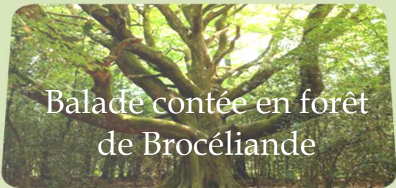
Balade contée en forêt de Brocéliande