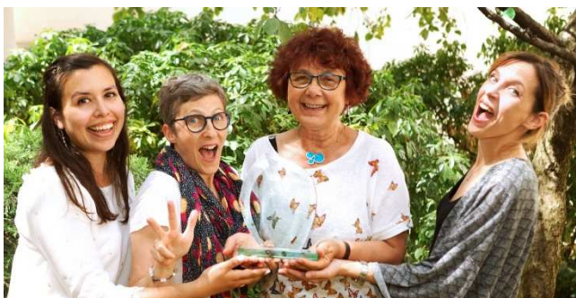
L'Unafam et la Fondation Fondamental ont reçu le Prix Coup de cœur 2019 des ROCS pour la campagne " Schizophrénie, bonheur & cie "

La Fondation « FondaMental » avec l'Unafam sont très fiers d'avoir reçu le Prix Coup de cœur 2019 des ROCS décerné par le Réseau Communication Santé pour la campagne digitale "Schizophrénie, bonheur & cie", réalisée avec le concours de Service plan France et le soutien de Klesia et de la Fondation Roger de Spoelberch.