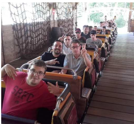
Quelques Bénéficiaires dans le wagon du Corsaire